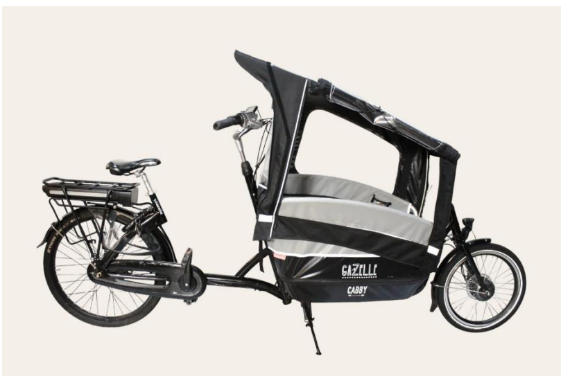
De regenhuis is nu klaar voor gebruik.