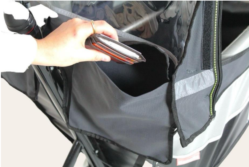
17. Zo zou je regenhuis Myra uit moeten zien.